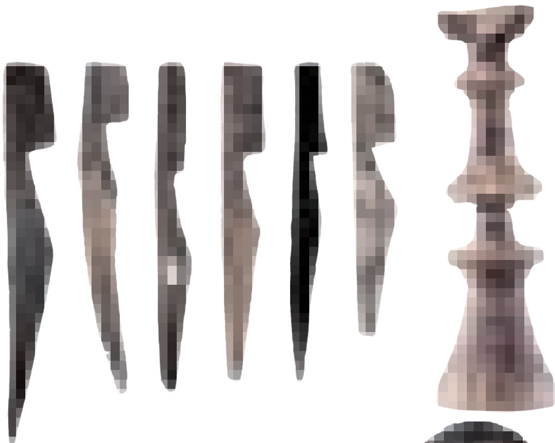
Hierboven: tentharingen van els, es en eikenhout. Rechtsboven: gedraaide beddenpoot van eikenhout. Hieronder: houten blokschaaf . Rechtsonder: druivenstok of vitis , een onderscheidingsteken van centurio's

Veel van het hout kon worden ondergebracht in zestien categorieën, variërend van wapens en dakbedekking tot textielbewerking en spel en ontspanning. Maar lang niet alles kon worden herkend. Lange: „Juist de objecten waarvan de functie niet bekend is, moeten worden gepubliceerd - bij Velsen weet ik van 209 fragmenten niet wat het is. Misschien weet iemand anders het wel.”